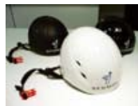
ヘルメット (ロゴ入り) マットブラック・ブラック・ホワイト 各色 15,000円