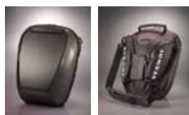
ハンドルバー・バック 30,000円