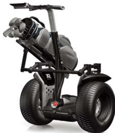
Segway PT x2 ゴルフ向けパッケージ 販売価格 ¥1,125,000- (税抜き、別途保険料が必要)